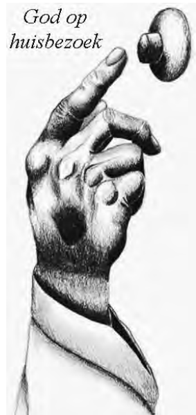
God op huisbezoek

vanuit de vroege morgenstilte dank ik U simpelweg voor de zon in het blauw de boom in het groen de vogel in de lucht de herinnering in een lach en voor Uw liefde in dit al